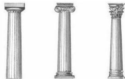
dorycka jonska koryncka

PODPOWIEDŹ – porządki architektoniczne starożytnej